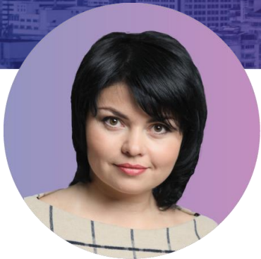
Коммерческий директор процессингового центра БПЦ

Группа компаний БПЦ – лидирующий поставщик решений для платежной индустрии: вендор программного обеспечения SmartVista, независимый процессинговый центр, платежной шлюз электронной коммерции.